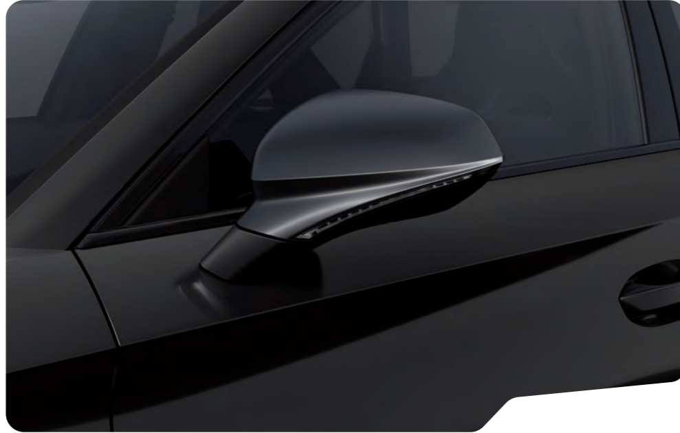
↓ MIDNIGHT SİYAH