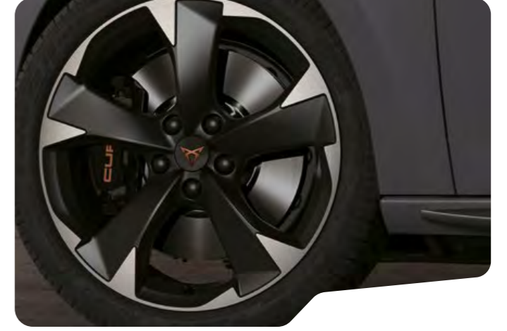
↓ 19" SİYAH/GÜMÜŞ EXCLUSIVE 30/1 MACHINED VZ