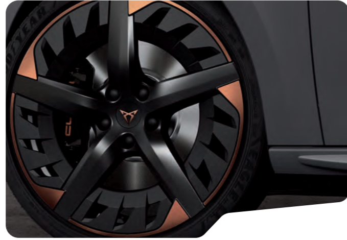
↓ 19" AERO SİYAH/BAKIR EXCLUSIVE 30/5 MACHINED 1 VZ