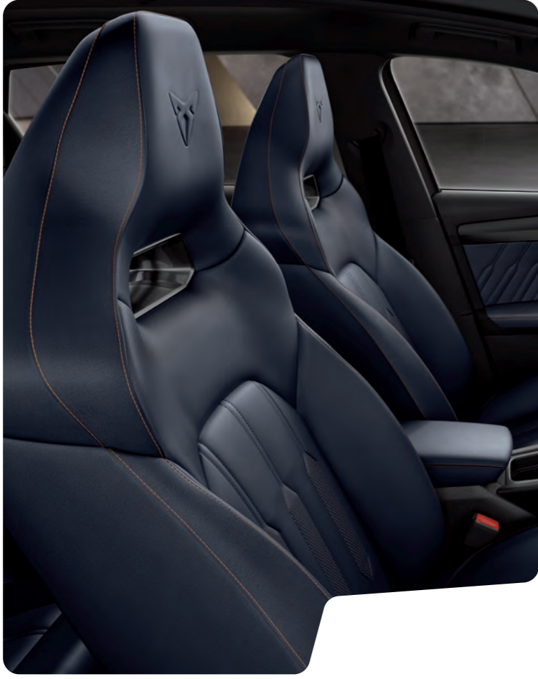
↑ 'BUCKET' TİP KOLTUKLAR VE BAKIR RENGİ DİKİŞLİ MAVİ NAPPA DERİ L VZ

CUPRA Leon L CUPRA Leon VZ VZ Standart ■ Opsiyonel ■