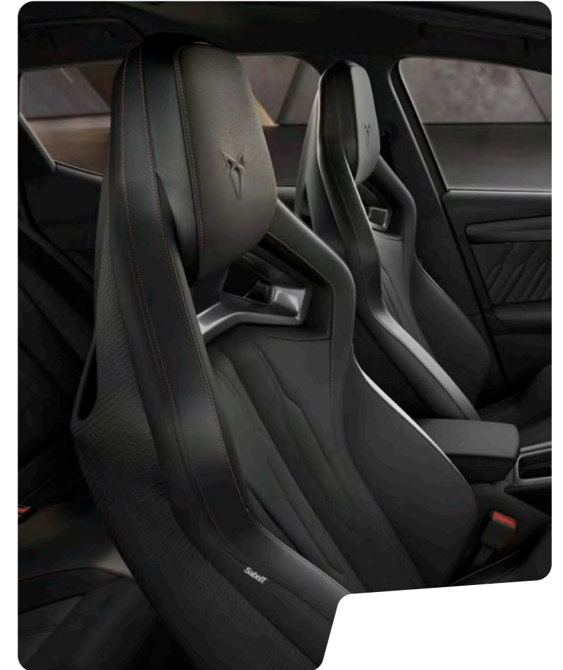
→ 'CUP BUCKET' TİP KOLTUKLAR VE BAKIR RENGİ DİKİŞLİ SİYAH NAPPA DERİ VZ

CUPRA Leon L CUPRA Leon VZ VZ Standart L Opsiyonel L