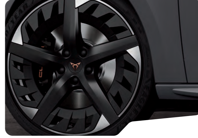
→ 19" AERO SİYAH/GÜMÜŞ EXCLUSIVE 30/2 MACHINED 1 VZ