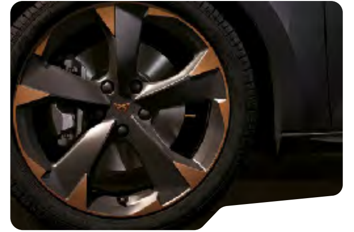
↓ 18" MAT SİYAH/BAKIR ALÜMİNYUM ALAŞIMLI JANTLAR L

CUPRA Leon L CUPRA Leon VZ VZ Standart L Opsiyonel L 1 Brembo frenlerle uyumlu değildir.