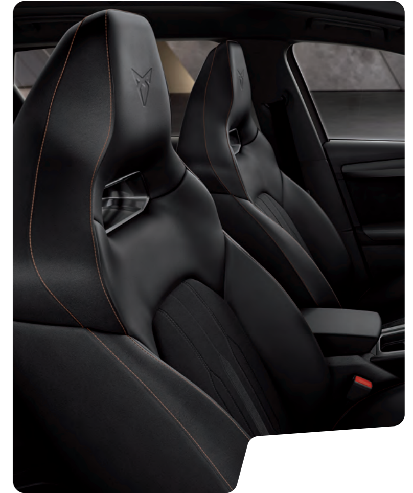
→ 'BUCKET' TİP KOLTUKLAR VE BAKIR RENGİ DİKİŞLİ SİYAH KUMAŞ L VZ