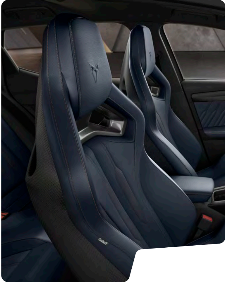
↑ 'CUP BUCKET' TİP KOLTUKLAR VE BAKIR RENGİ DİKİŞLİ MAVİ NAPPA DERİ VZ