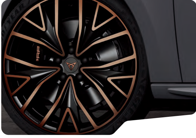
↑ 19" SİYAH/BAKIR EXCLUSIVE 30/4 MACHINED VZ