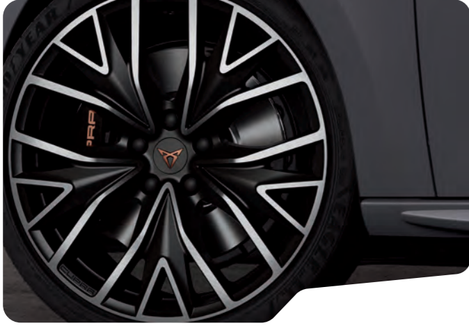
↑ 19" SİYAH/GÜMÜŞ EXCLUSIVE 30/3 MACHINED VZ