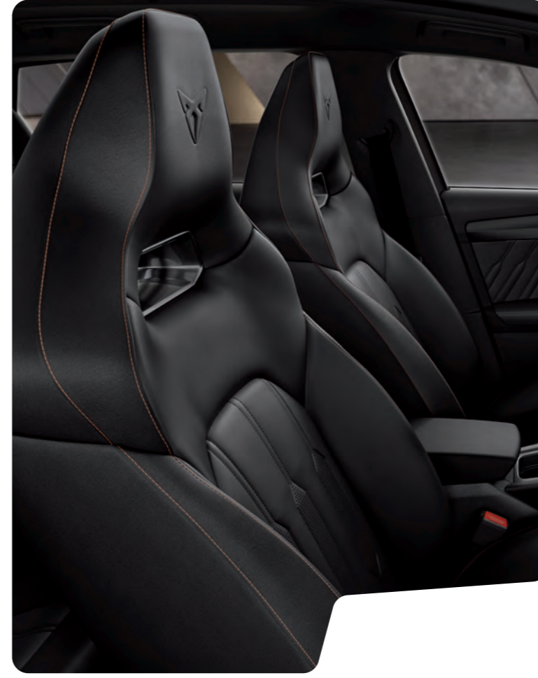
← 'BUCKET' TİP KOLTUKLAR VE BAKIR RENGİ DİKİŞLİ SİYAH NAPPA DERİ L VZ

Bu katalogta kullanılan görseller ve özellikler, sunulduğu ülkeye/pazara göre değişiklik gösterebilir ve/veya standart donanıma dahil olmayan opsiyonel donanımlar ile aksesuarlar içerebilir.