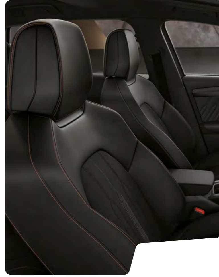
← SPOR TİP KOLTUKLAR VE BAKIR RENGİ DİKİŞLİ SİYAH KUMAŞ L