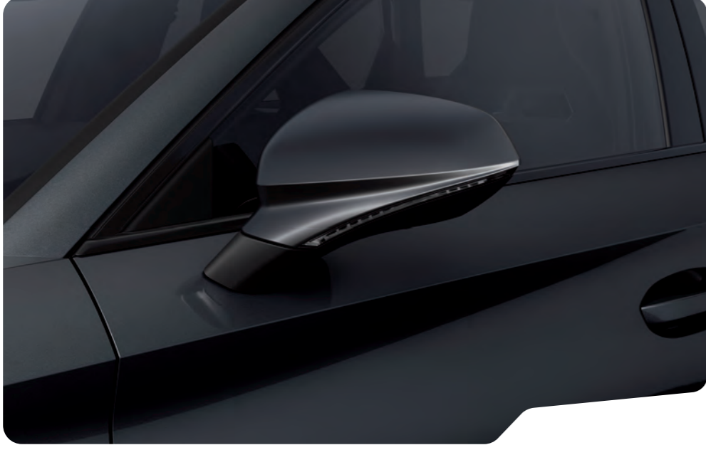
↓ MAGNETIC GRİ