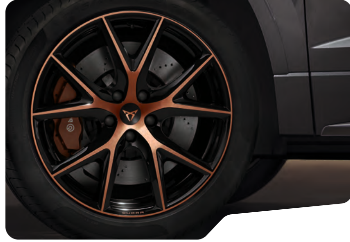
← 19" SİYAH/BAKIR EXCLUSIVE 36/3 MACHINED 1 O