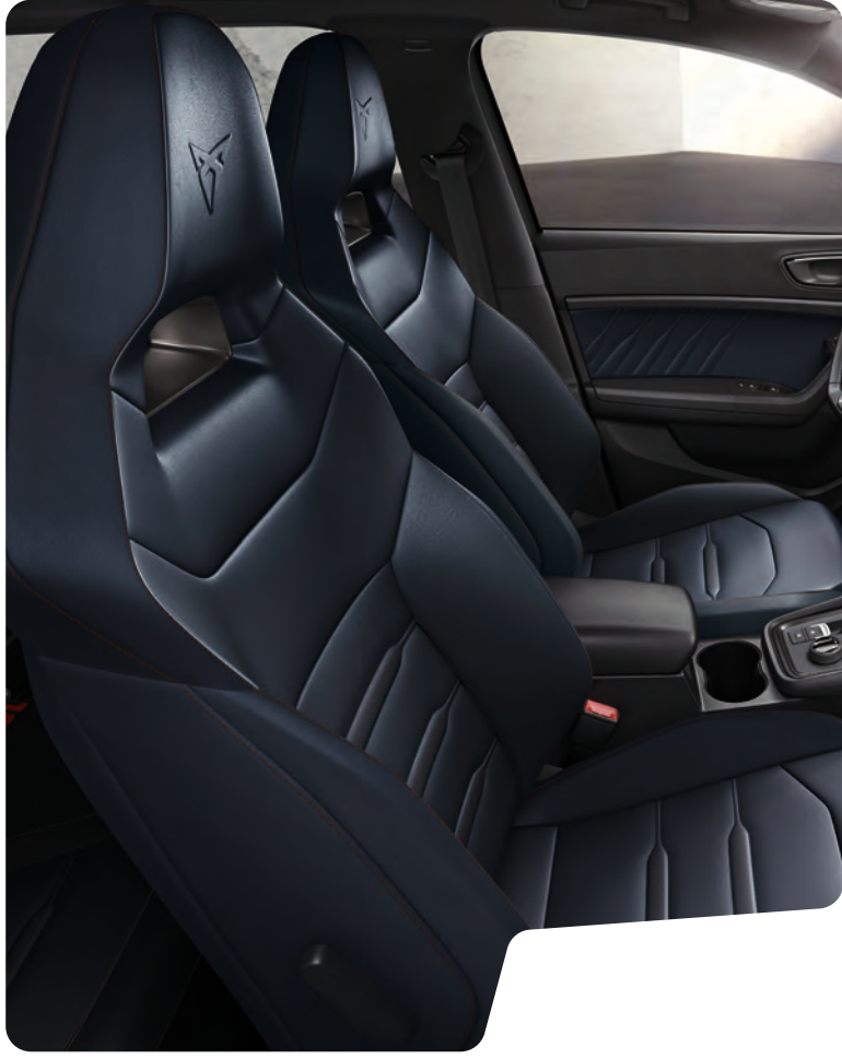
↑ 'BUCKET' TİP KOLTUKLAR VE BAKIR RENGİ DİKİŞLİ MAVİ NAPPA DERİ

Bu katalogta kullanılan görseller ve özellikler, sunulduğu ülkeye/pazara göre değişkenlik gösterebilir ve/veya standart donanıma dahil olmayan opsiyonel donanımlar ile aksesuarlar içerebilir.