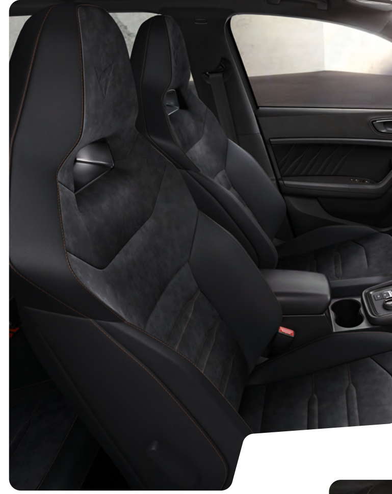
← 'BUCKET' TİP KOLTUKLAR VE BAKIR RENGİ DİKİŞLİ SİYAH DİNAMICA DÖŞEME

Bu katalogta kullanılan görseller ve özellikler, sunulduğu ülkeye/pazara göre değişkenlik gösterebilir ve/veya standart donanıma dahil olmayan opsiyonel donanımlar ile aksesuarlar içerebilir.