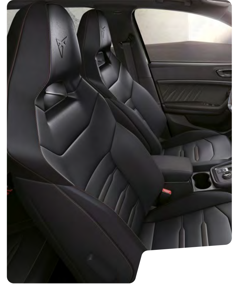
→ 'BUCKET' TİP KOLTUKLAR VE BAKIR RENGİ DİKİŞLİ SİYAH NAPPA DERİ