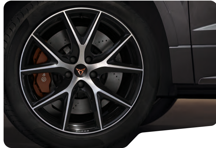
→ 19" SİYAH/GÜMÜŞ EXCLUSIVE 36/2 MACHINED 1 O

Bu katalogta kullanılan görseller ve özellikler, sunulduğu ülkeye/pazara göre değişiklik gösterebilir ve/veya standart donanıma dahil olmayan opsiyonel donanımlar ile aksesuarlar içerebilir.