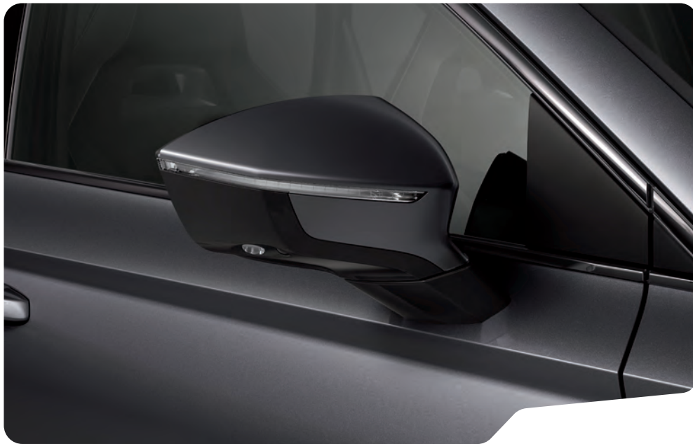
↓ GRAFİT GRİ