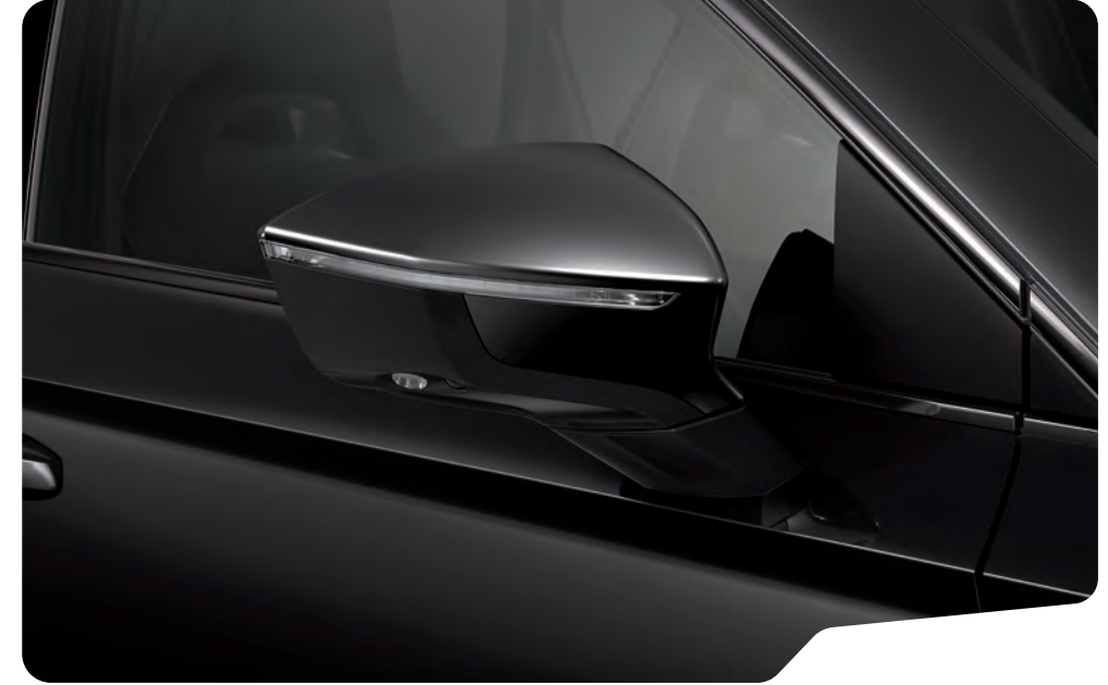
↓ KAMUFLAJ YEŞİL