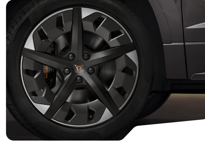
→ 19" AERO SİYAH/GÜMÜŞ EXCLUSIVE 36/4 MACHINED 2 O