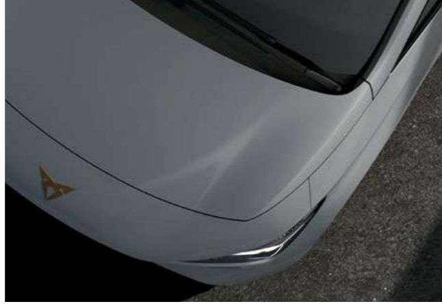
→ VAPOR GRİ 3