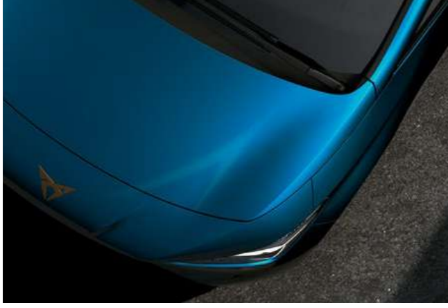
← AURORA MAVİ 3