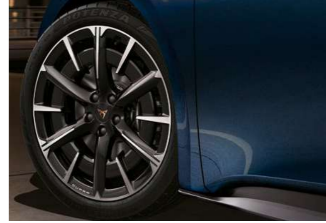
← 20" FIRESTORM Mat Siyah/Gümüş Alüminyum Alaşımlı Jantlar