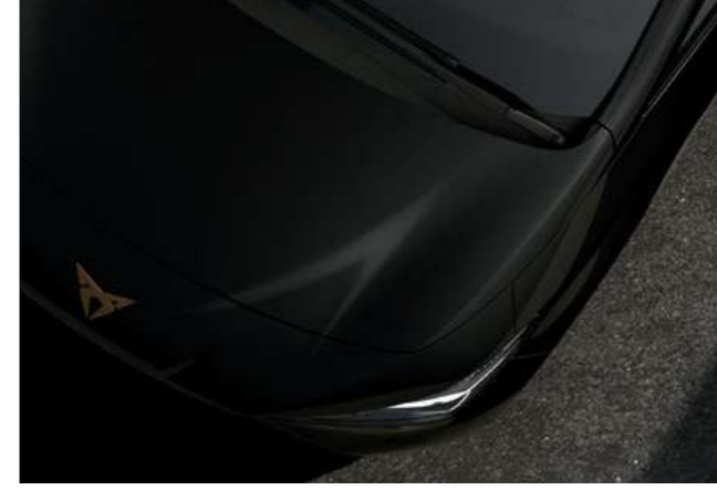
← MIDNIGHT SİYAH 2