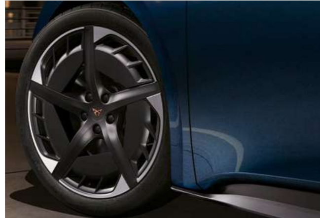
→ 20" HURRICANE 1 Mat Siyah/Gümüş Aero Jantlar