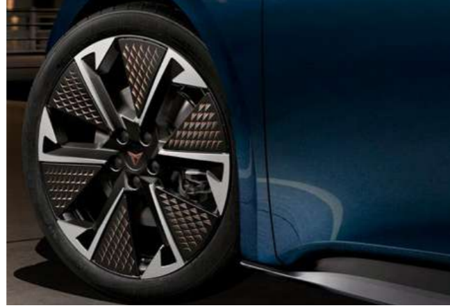
→ 20" THUNDERSTORM Mat Siyah/Bakır Aero Jantlar