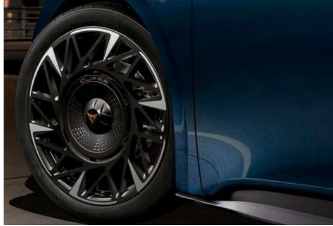
← 20" TORNADO Mat Siyah Aero Jantlar