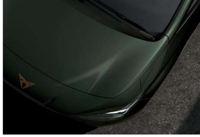
→ ORMAN YEŞİLİ 3