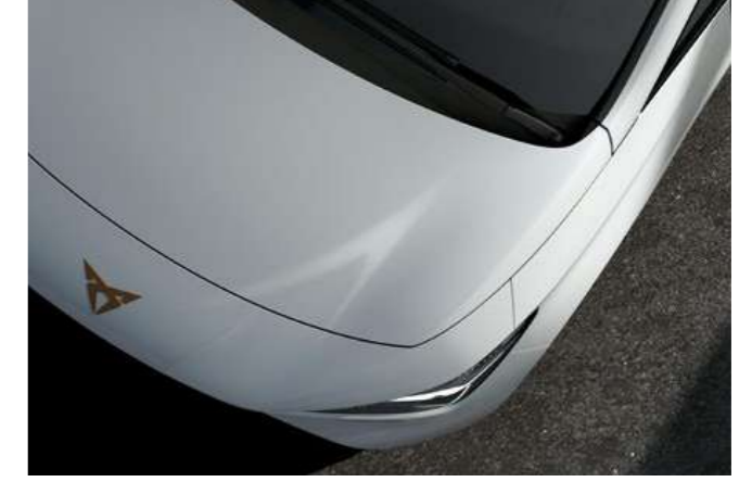
← GEYSER GÜMÜŞ GRİ 1